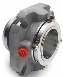
DMSF™ / DMSC™