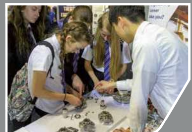
エンジニアリングを若者に推奨。