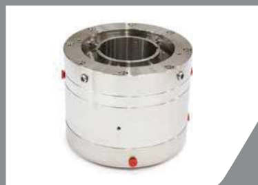
HPVD™ダブルメカニカルシール