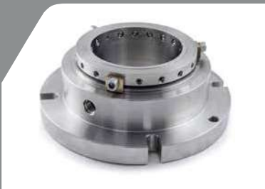
SCMS™ - ショットキャニスターミキサーシール