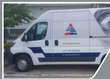
48時間に標準品を納入

部品が最も必要とされる場所で確実に提供できるよう、世界中の主要な拠点にグローバルセールスの約10%を在庫として確保しています。