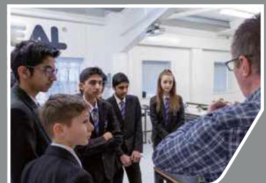
地元のカレッジやユニバーシティと連携。

また、AESSEALは安全を最優先し、働きがいのある職場を創造することで、学生から選ばれる企業になるよう努力しています。