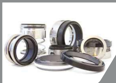
コンポーネント型シール