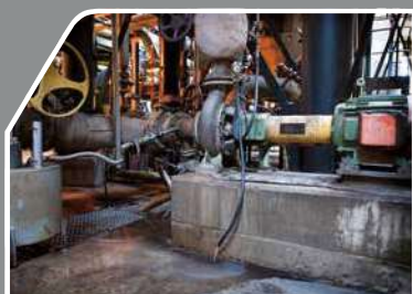
従来のクエンチドレンシステム