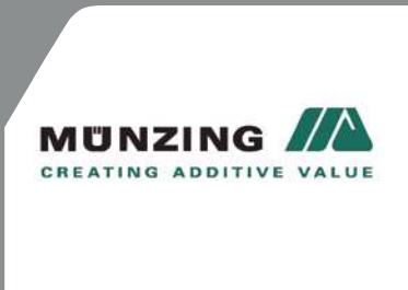
ドイツの化学製品メーカー