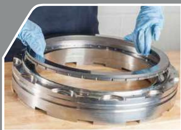
ドライガスシールアセンブリ