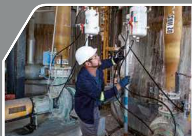
水循環管理システム