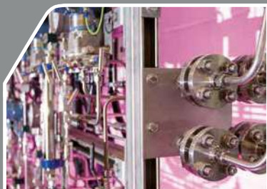
ドライガスシールサポートシステム

数十年にわたり年間売上高の7%以上を研究開発に投資しているため、AESSEALの製品には世界最先端のシール技術がつまっています。