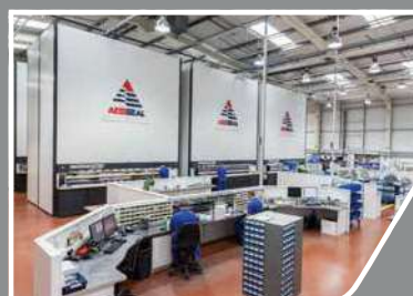
在庫管理システム