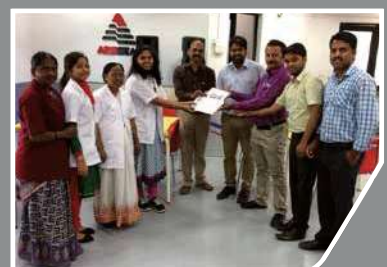
世界中の慈善団体を支援。