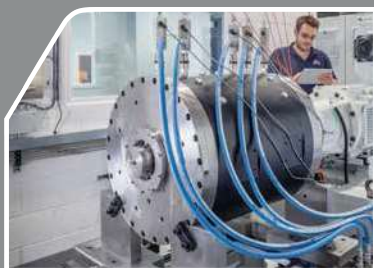
大口径ドライガスリグ