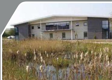
本社付近の湿地帯