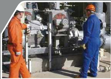
現地で働いているエンジニア