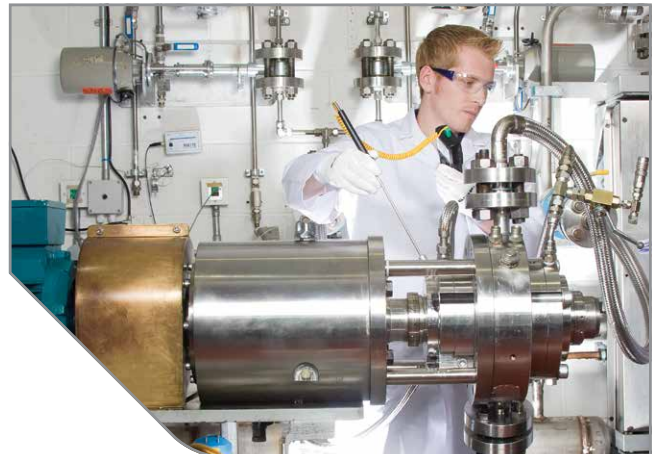
API yeterliliklerinin testi için 2 adet test ünitesi