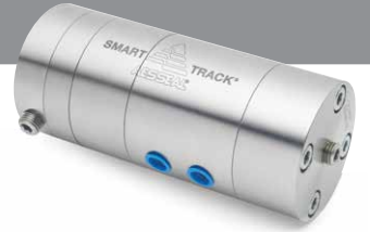
Smart Track® Değişken basınçlı proseslerde fark basıncını sabit tutabilmek için geliştirilmiştir.