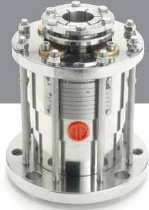
Mixmaster V™ içten balanslı mekanik salmastra