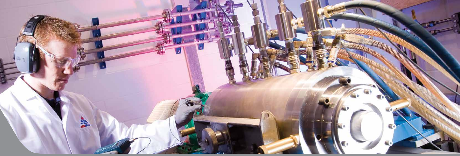
"DRY" Gaz Kompresör salmastrası test ünitesi

AESSEAL® petrol ve Gaz endüstrilerinin referans kalite standartı olan ISO 29001 sertifikasına sahiptir.