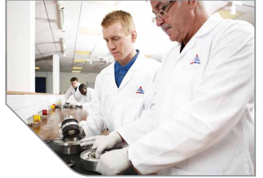
AESSEAL® test mühendisleri ile ana test tesisi