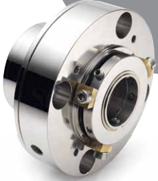
(ANSI/API Standard 682) uygun pompalarda kullanılan CAPI-74™ temassız çiftli salmastra