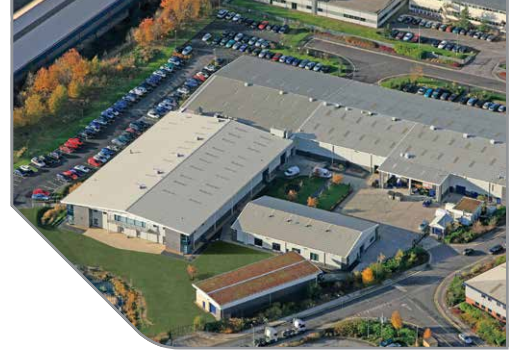
AESSEAL® Global Test Teknoloji Merkezi

45000 d/d hıza, 5000 psig (350 barg) basınca, 536°F (280°C) sıcaklığa kadar