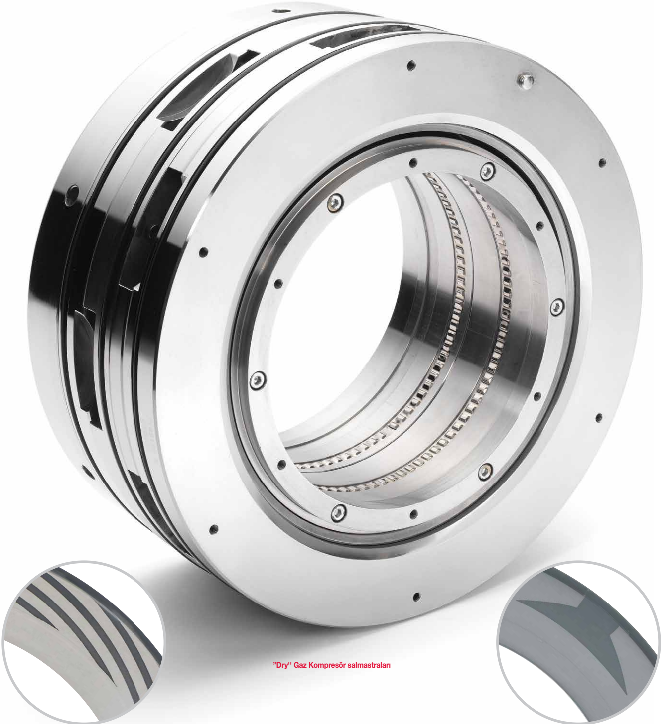
"Dry" Gaz Kompresör salmastraları

Ayrıca tam olarak tüm seri tek yönlü ve dönüş yönünden bağımsız, temassız gaz içeren salmastra, reaktör ve mikserler için geleneksel hidrodinamik "DRY" gaz kompresör salmastraları üretiriz.