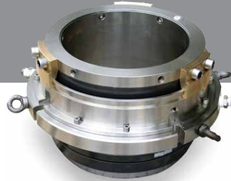
11.5" (290mm) Maden salmastrası